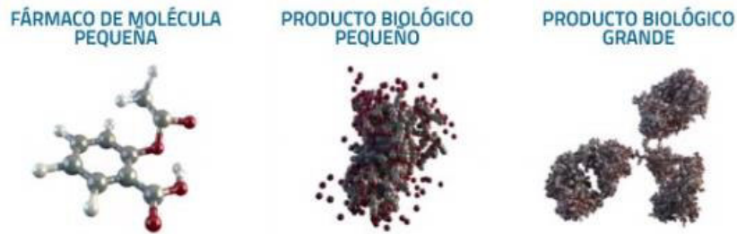
Figura 1. Comparación de un fármaco de síntesis con los productos biológicos 12 .

estructuras de mayor complejidad que los fármacos tradicionales 12,13 (Figuras 1 y 2) (Tabla 1).