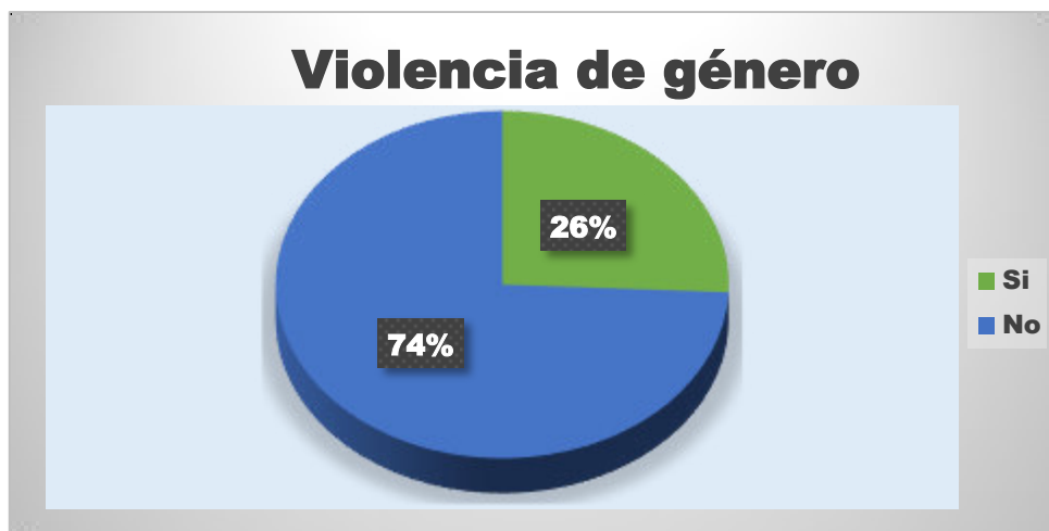
Gráfico N°1: Presencia de violencia de género durante la gestación en las puérperas atendidas en el Instituto Nacional Materno Perinatal, 2016.

En el gráfico N°1 se observa la presencia de violencia de género, donde el 74% de las puérperas manifestaron no haber sufrido de violencia de género durante la gestación, mientras el 26% de puérperas refirieron algún tipo de violencia.