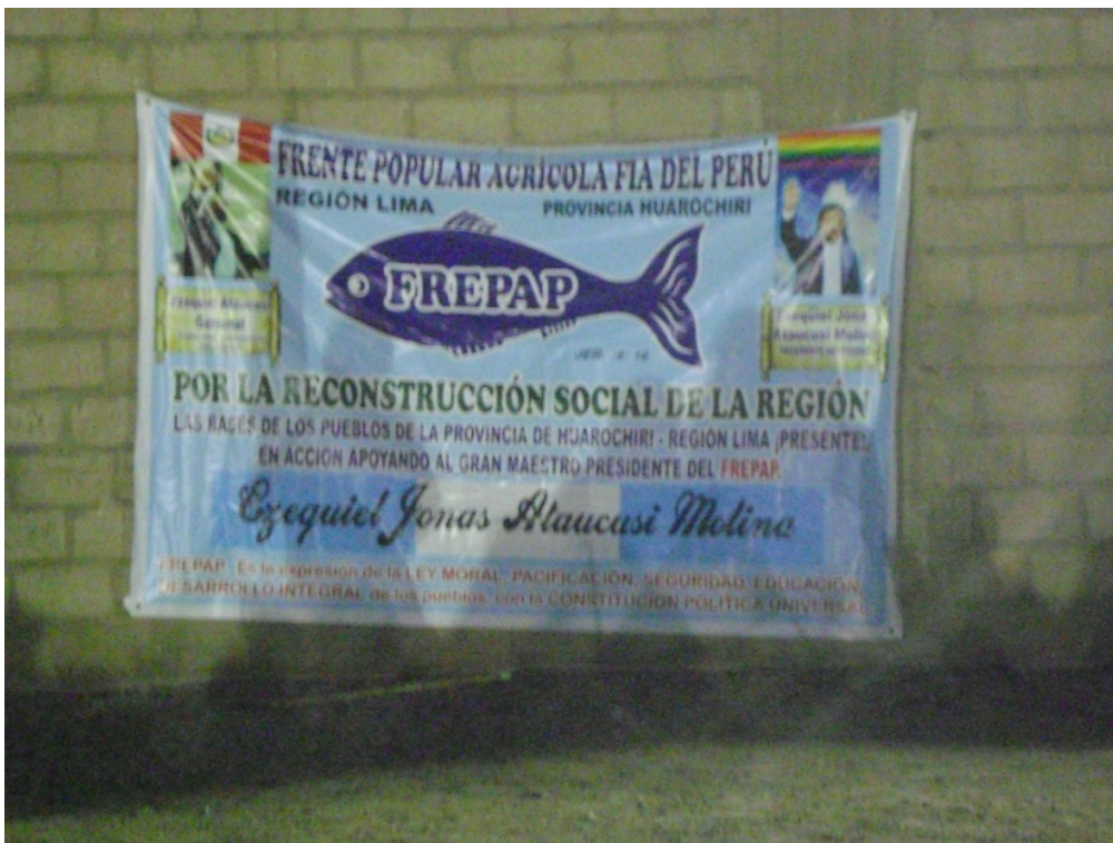
Pancarta del FREPAP (29-09-14)