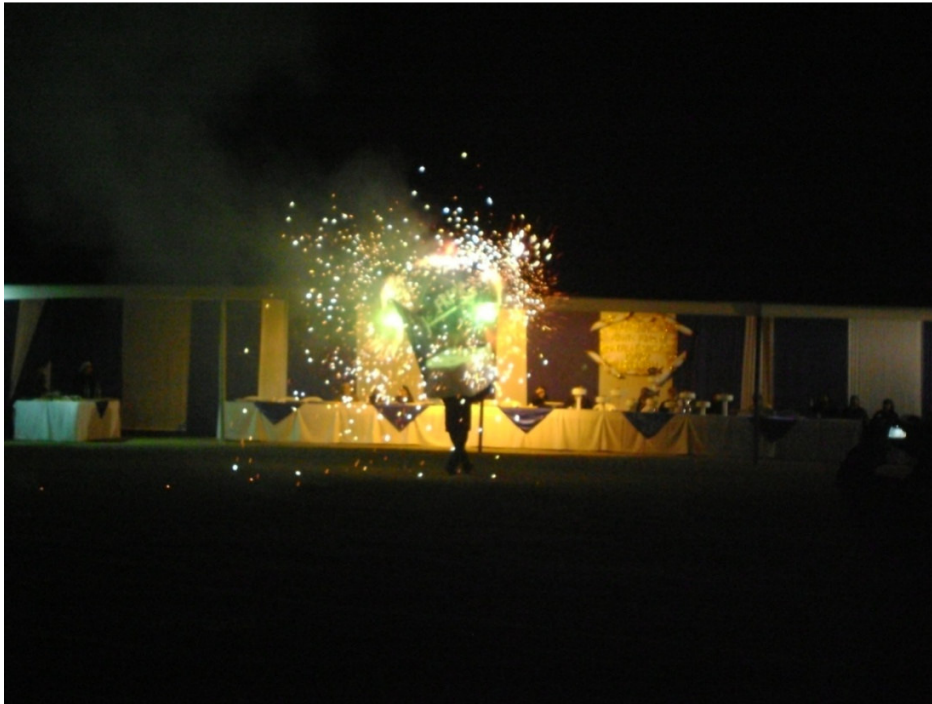
Celebraciones por el aniversario 24 del FREPAP, Iglesia Matriz, Cieneguilla, Lima (29-09-13)