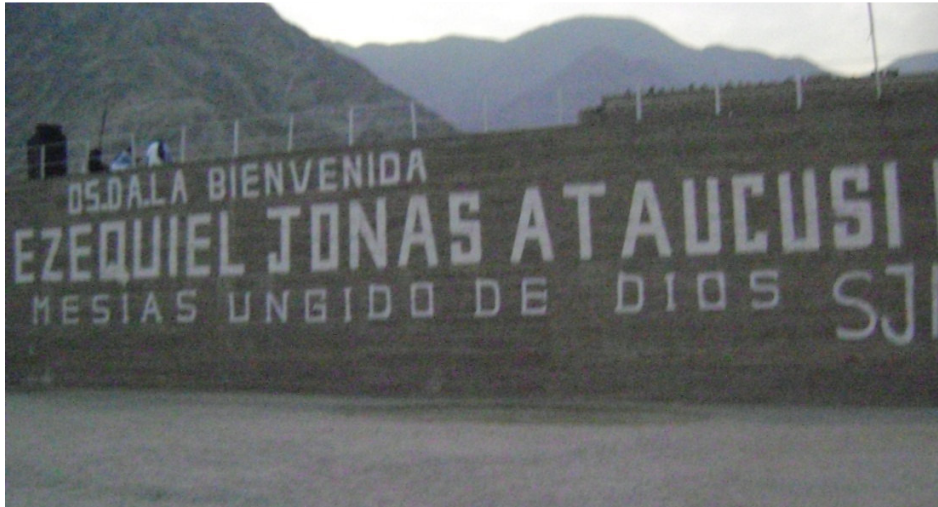
Portada inferior izquierda del templo, Cieneguilla, Lima