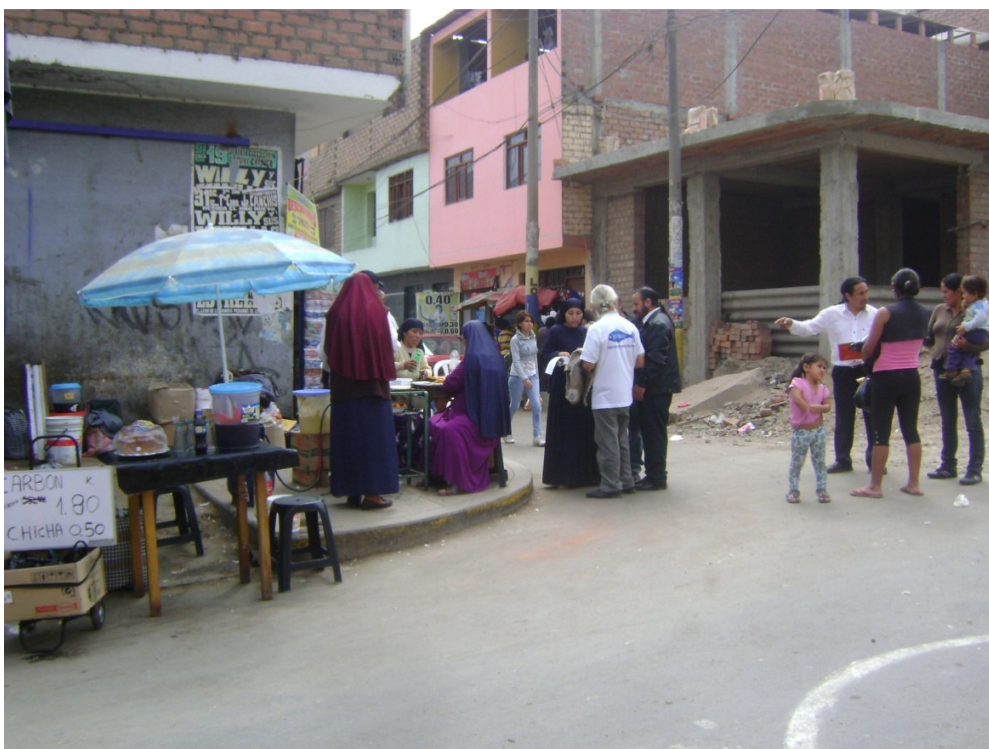
Recolección de firmas pro-inscripción del FREPAP, Mercado de Tahuantinsuyo, Independencia, Lima (02-06-13)