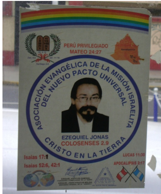
Propaganda de la AEMINPU en transporte público