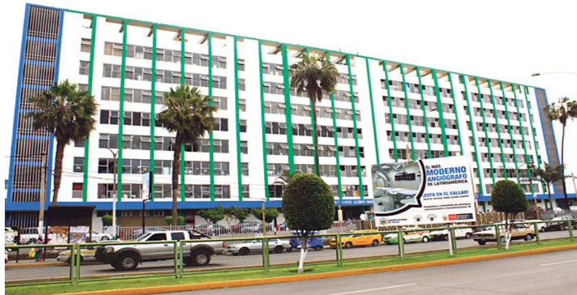
FIGURA A: Hospital Nacional Daniel A. Carrión – Callo 2015