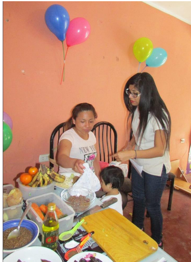
Realización de un taller de alimentación complementaria como agradecimiento a las madres que participaron en el estudio