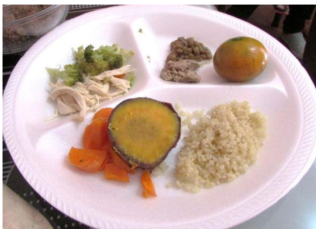
Evaluando las características de alimentos complementarios brindado por una de las madres de un niño de 1 año 6 meses de edad