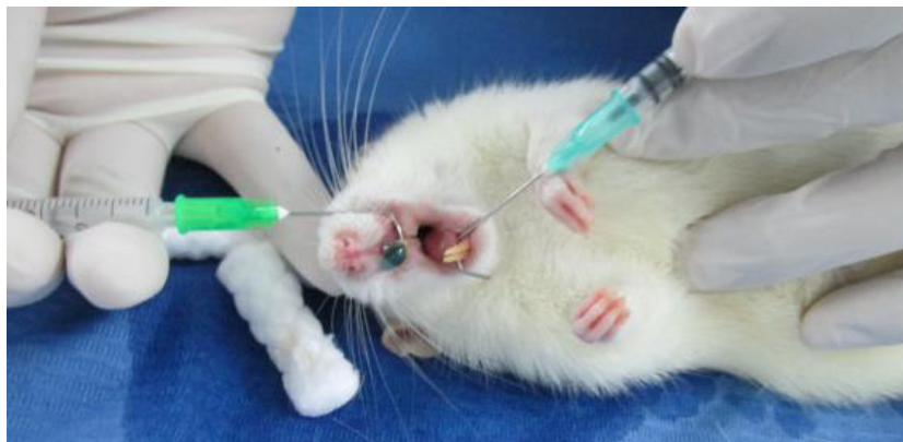
Fotocurado de la resina