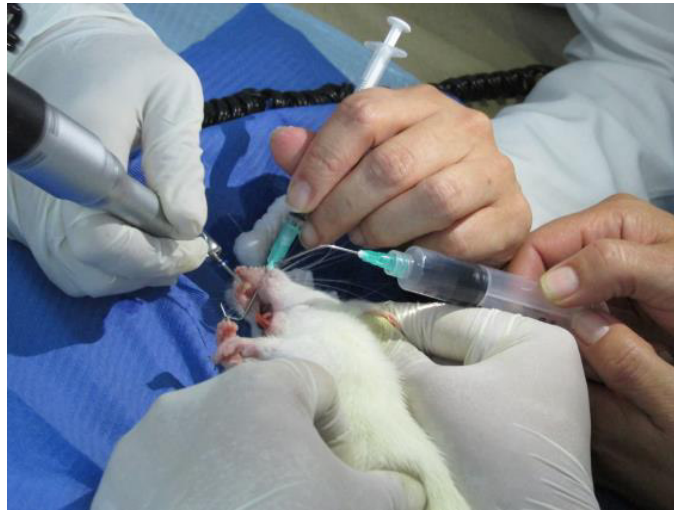
Acondicionado de los dientes.