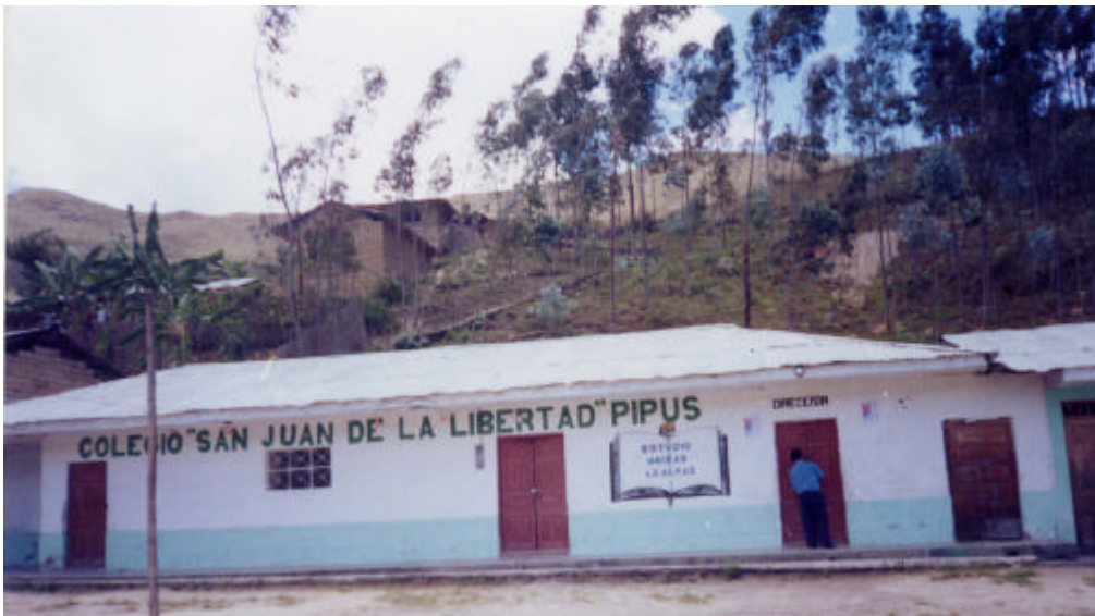
Imagen 2. Colegio secundario "San Juan de la Libertad"