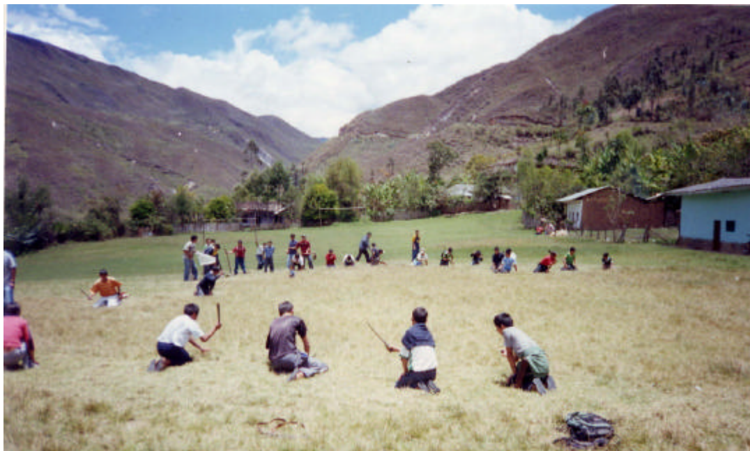
Imagen 4. Alumnos de secundaria preparan el campo de fútbol