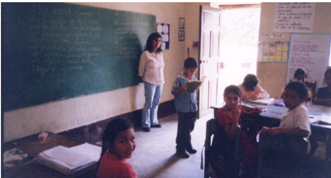
Imagen 6. Aula multigrado (1ero, 2do, y 3er grado)