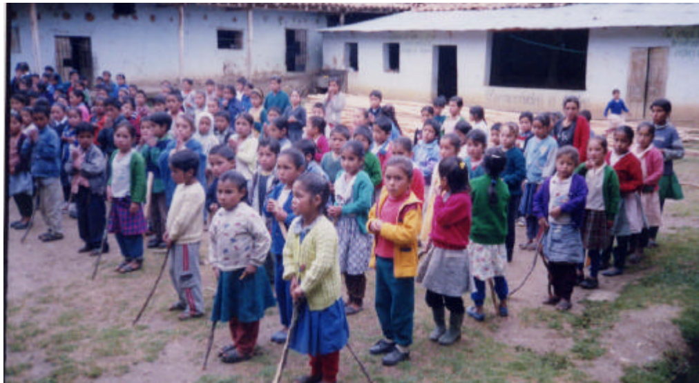
Imagen 4. Alumnos de primaria en formación con su ramita de leña.