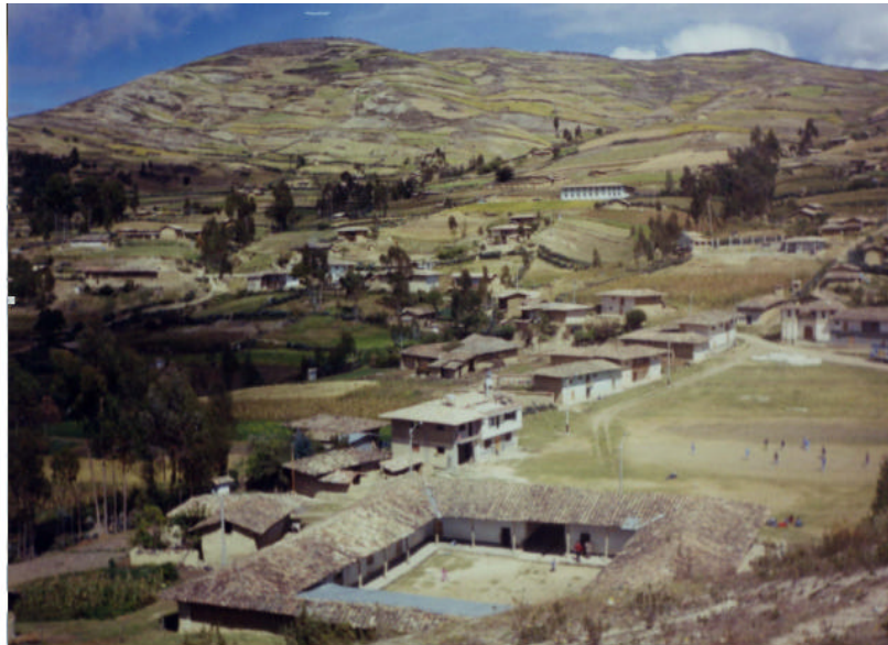
Imagen 1. Vista panorámica de Lic Lic