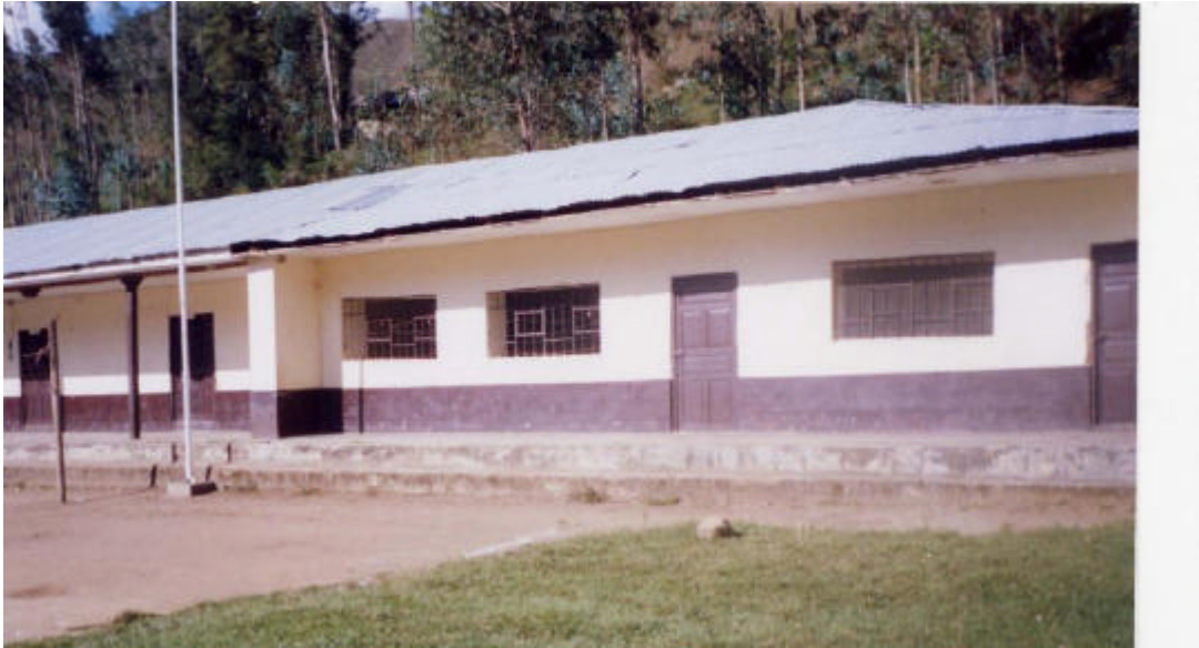
Imagen 5. Escuela Primaria