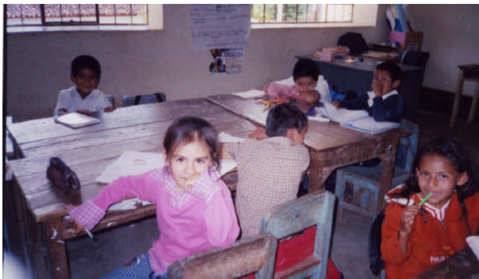
Imagen 7. Aula multigrado (4to, 5to, y 6to grado)