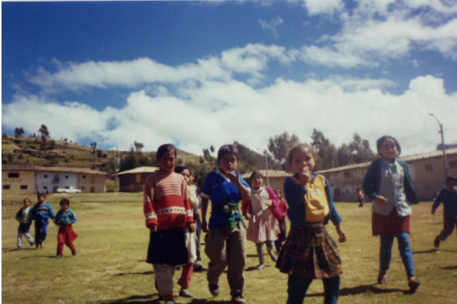
Imagen 7. Alumnos en el recreo