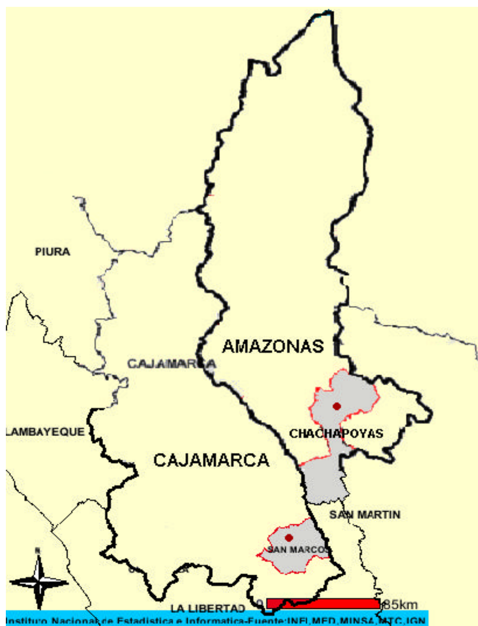
Mapa 1. Ubicación geográfica