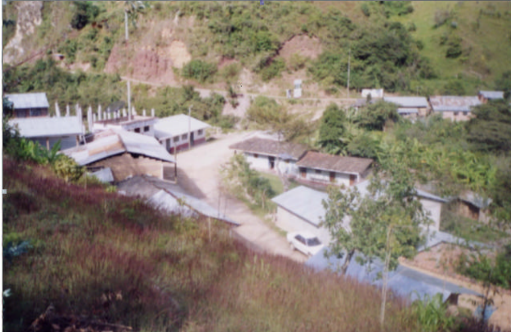
Imagen 1. Vista panorámica de Pipus