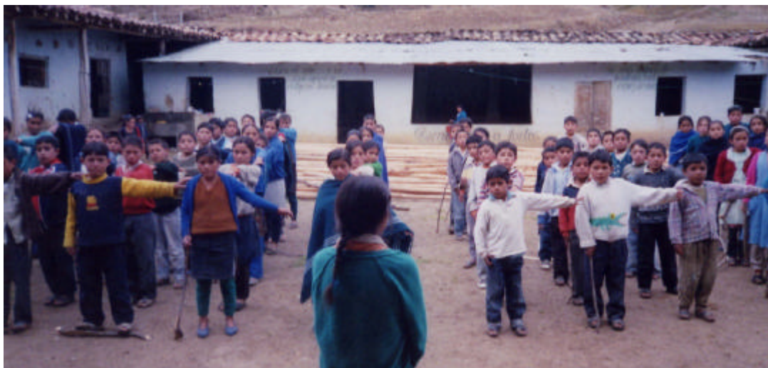
Imagen 5. Alumnos de primaria en formación.