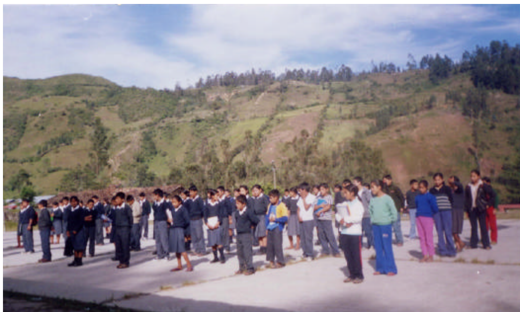
Imagen 3. Alumnos de Secundaria en formación.