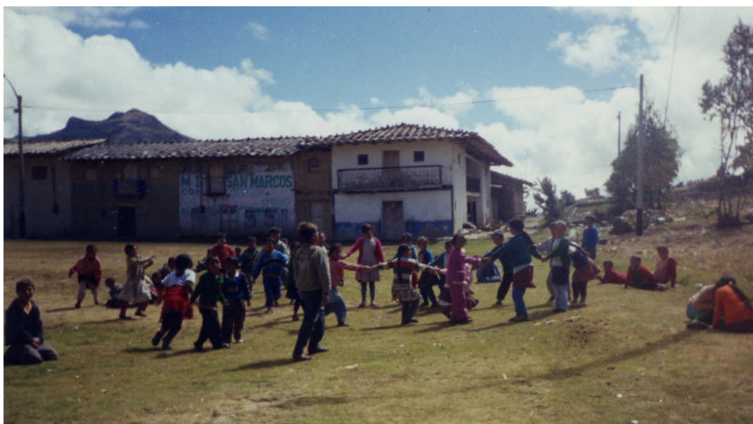
Imagen 6. Alumnos en recreo.