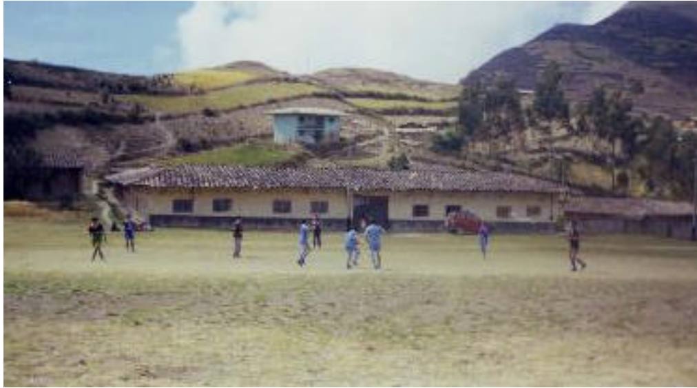
Imagen 3. Escuela primaria.