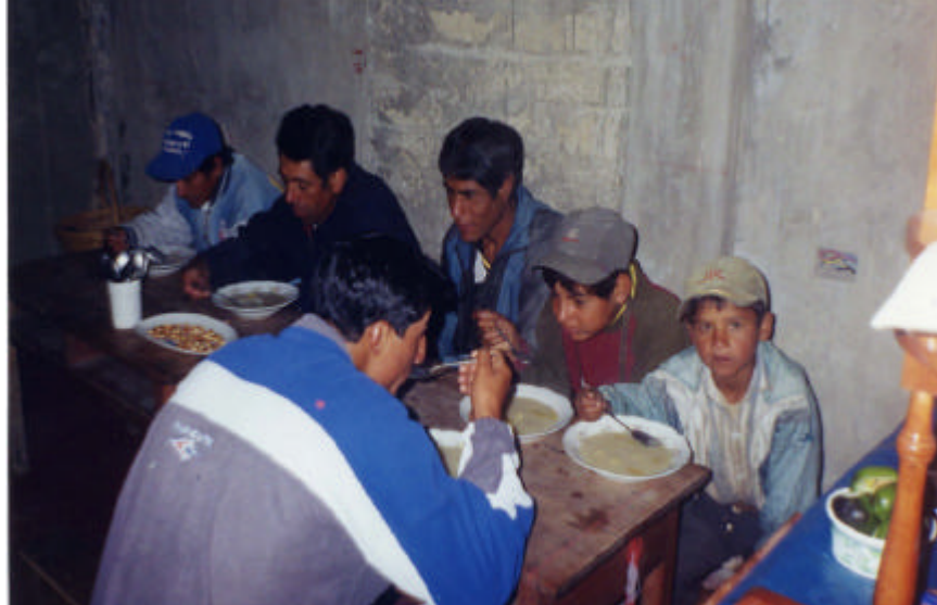
Imagen 8. Peones tomando desayuno