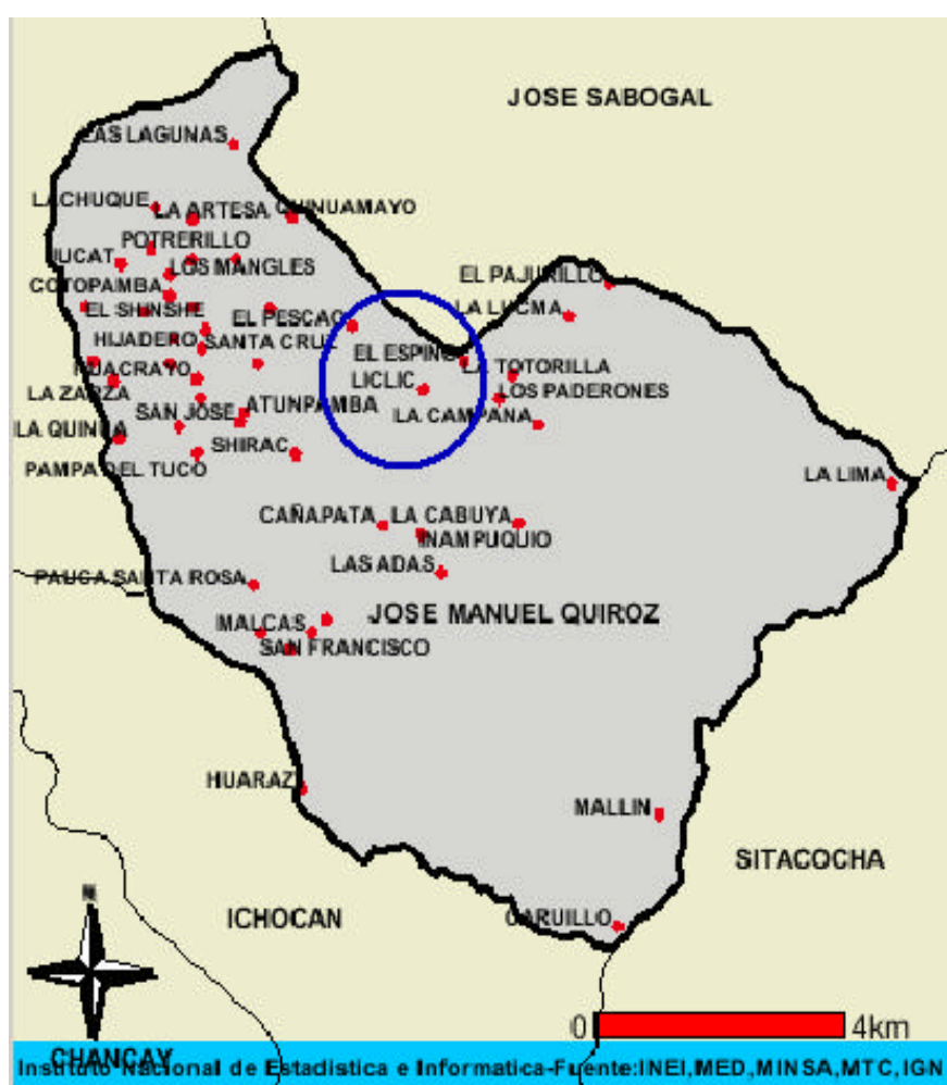
Mapa 2. Ubicación geográfica