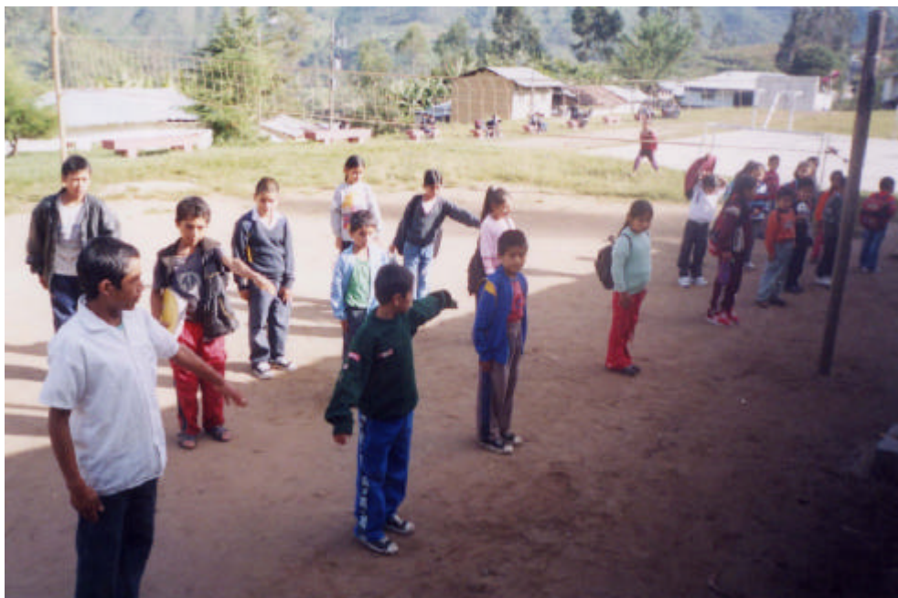
Imagen 8. Alumnos de primaria en formación