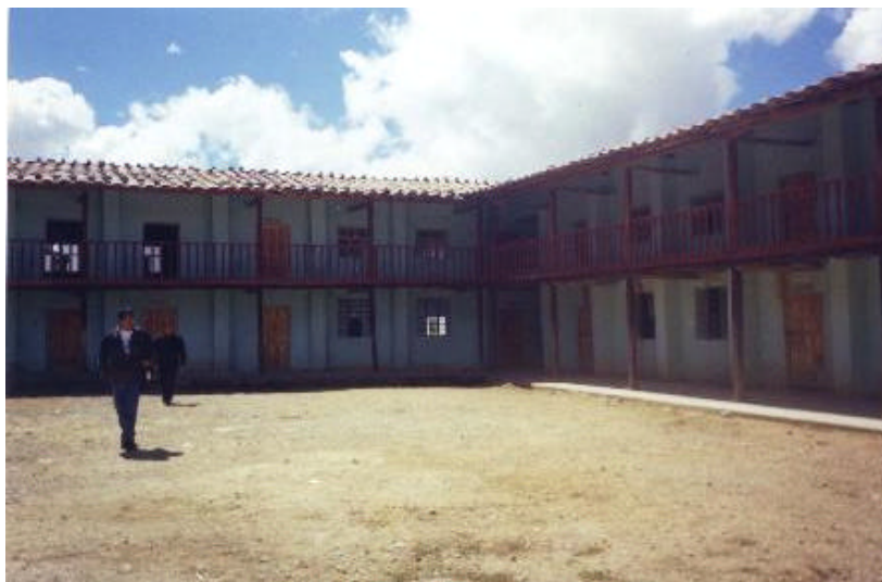
Imagen 2. Colegio Secundario