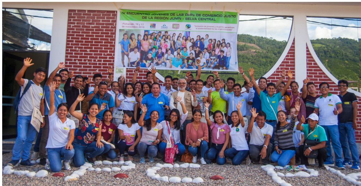
IV Encuentro Jóvenes de las OPS de Comercio Justo de la Región Junín – Selva Central, 2019