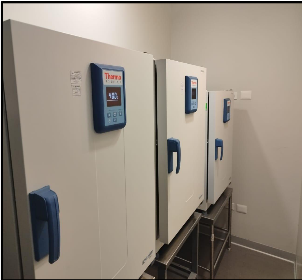
Figura 3: Área de Estufas para estudio de estabilidad acelerada a 40^{\circ}\text{C} .