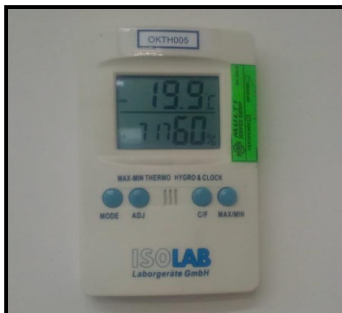
Figura 5: Registro de temperatura del laboratorio a temperatura ambiente.