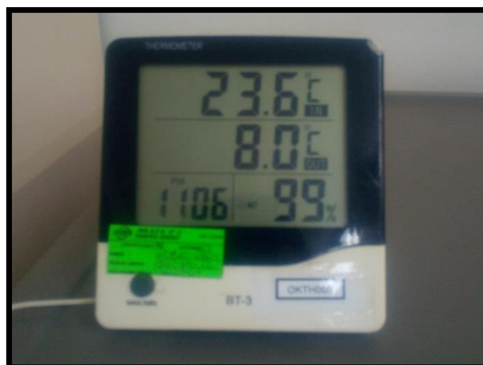
Figura 6: Registro de temperatura en heladera a temperaturas bajas