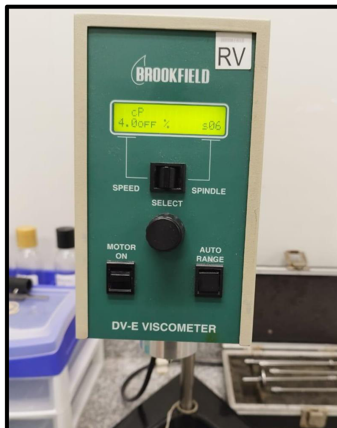
Figura 10: Viscosímetro Brookfield DV-E

La viscosidad se mide en Centipoise (cP) siendo la unidad de medida con la que se registra los valores obtenidos. La viscosidad se medirá utilizando el Viscosímetro Brookfield Modelo RVDVE230 /DV-E VISCOMETER y siguiendo el instructivo de Determinación de Viscosidad.