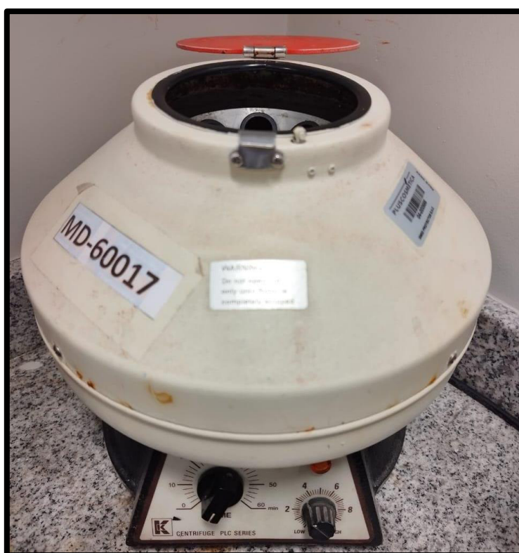
Figura 8: TABLE TOP CENTRIFUGA GERMANY

pH: Se evalúa la estabilidad del pH a lo largo del periodo de evaluación. El pH se mide a todo producto cuya formulación contenga agua como solvente principal. El pH se medirá utilizando el POTENCIOMETRO MT SEVEN COMPACT modelo SEVEN COMPACT S220 de la marca Mettler Toledo, según indica su metodología e instructivo para dicho equipo de medición.